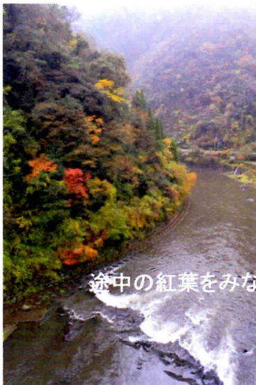
途中の紅葉をみながら