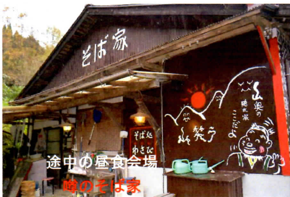
途中の昼食会場 噂のそば家