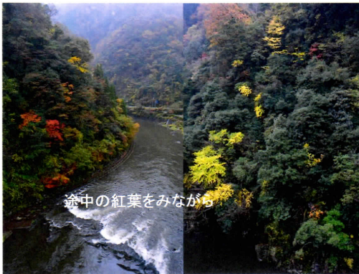
途中の紅葉をみながら