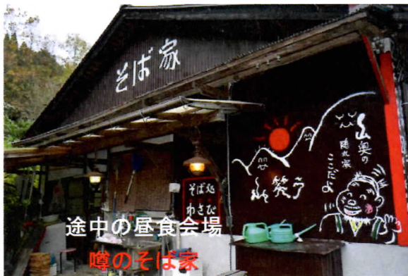
途中の昼食会場 噂のそば家