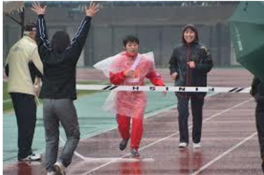
熊本中央ライオンズクラブ 熊本中央LC 障がい者駅伝大会