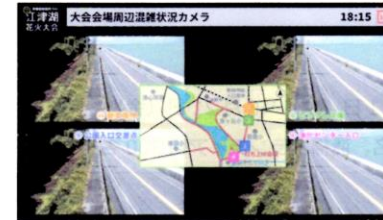
混雑状況配信画面