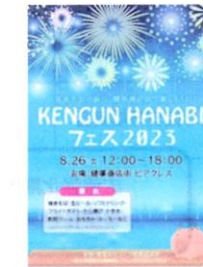
イベントのチラシ(昨年度)