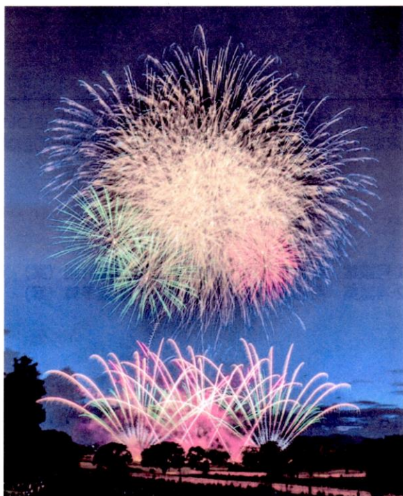
(写真：江津湖花火大会 2023)

日時：令和6年(2024年)4月18日(木)16時15分～ 会場：熊本市役所 議会棟2階 予算決算委員会室