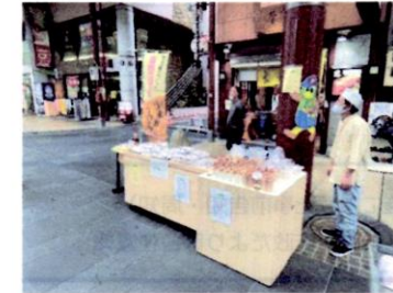
健軍商店街の様子