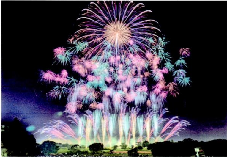
(写真:江津湖花火大会 2019)