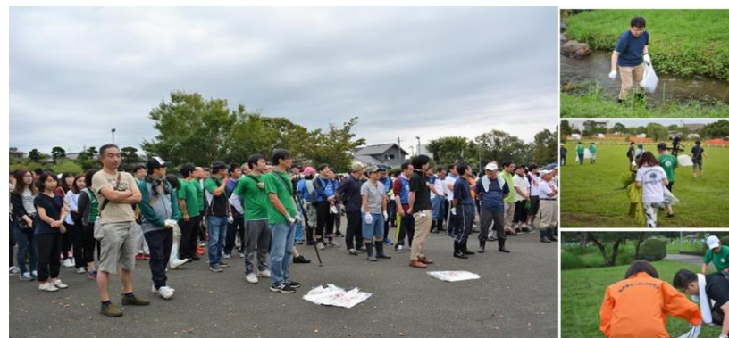
『今年こそは、1,000名で大清掃をしたい!!』 集まれボランティア